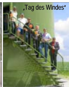
„Tag des Windes“