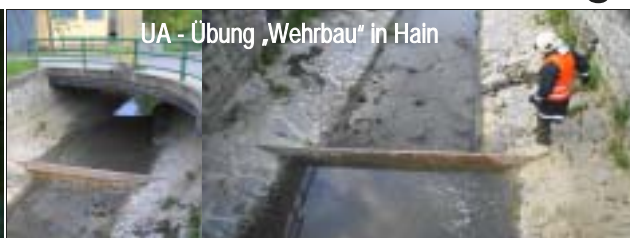
UA - Übung „Wehrbau“ in Hain