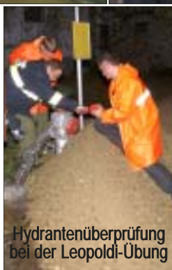
Hydrantenüberprüfung bei der Leopoldi-Übung