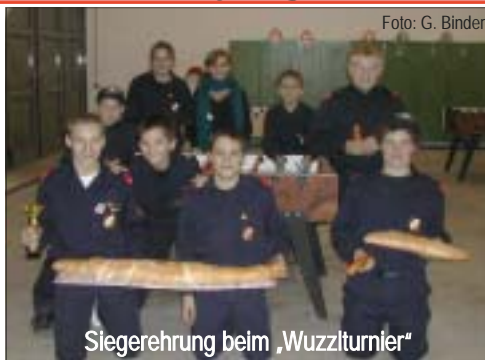
Siegerehrung beim „Wuzziturnier“

Jeden 2. Samstag treffen sich die Kids um 15 Uhr, um einerseits feuerwehrspezifische Ausbildung anzubieten, und andererseits eine sinnvolle und unterhaltsame Freizeitgestaltung, Spiel und Spaß zu haben.