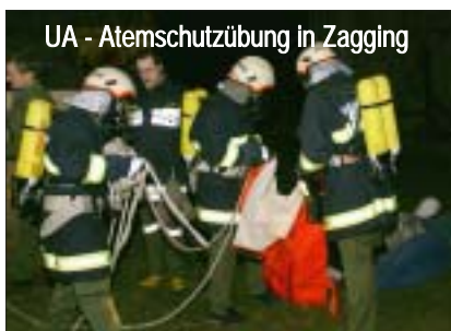
UA - Atemschutzübung in Zagging