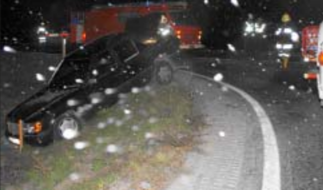
14.12.2007: VU – L100/L5068 („Herzogenburger Kreuzung“)