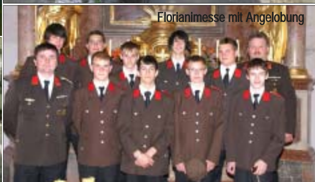
Florianimesse mit Angelobung