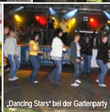
„Dancing Stars“ bei der Gartenparty