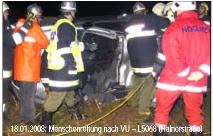
18.01.2008: Menschenrettung nach VU – L5068 (Hainerstraße)