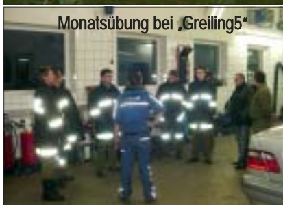
Monatsübung bei „Grelling5“